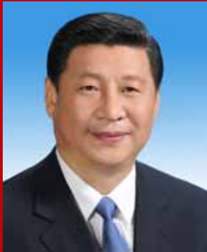
ෂී ජින් පිං(Xi Jinping)

මෙවර චීන කොමියුනිස්ට් පක්ෂ 18වන ජාතික නියෝජිත සම්මේලනයේදී චීන කොමියුනිස්ට් පක්ෂ අහිතව මහලේකම්වරයා ලෙස ෂී ජින් පිං මහතා තෝරා පත් කර ගැනිණ. කොමියුනිස්ට් පක්ෂ මධ්‍යමය කොමිසමේ සභාපති ධුරය ද ඔහුට හිමි විය. දැනට චීන මහජන සමූහාණ්ඩුවේ උප රාජ්‍ය සභාපතිවරයා වන ෂී ජින් පිං මහතා චීන රජයේ මාධ්‍යම යුධ කොමිසමේ උපසභාපතිවරයා ද වේ. කොමියුනිස්ට් පක්ෂ මධ්‍යම පාසලේ සභාපති ධුරය උසුලන්නේ ද ඔහු විසිනි. චීනයේ ශාන් ඡී පලාතේ හුපින්හිදී 1953 වසරේ ජූනි මාසයේදී ෂී ජින් පිං මහතා උපත ලැබීය. 1969 වසරේදී ශ්‍රමබලකායට එක් වූ හෙතෙම චීන කොමියුනිස්ට් පක්ෂයට එක්වූයේ 1974 වසරේදීය. විත්භූවා විශ්ව විද්‍යාලයේ මානවභා සමාජවිද්‍යා අංශයෙන් උපාධිය ලබා ගත් ඔහු, එහිදී මාක්ස්වාදය, සංකල්ප වාදය සහ දේශපාලන අධ්‍යාපනය හදා රඳු ලැබීය. ඒ පිලිබඳ ප්‍රශ්නවත් උපාධිය ද ලබා ඇති ෂී ජින් පිං මහතා නීතිය පිලිබඳ ආචාර්ය උපාධි දාරියෙකි.