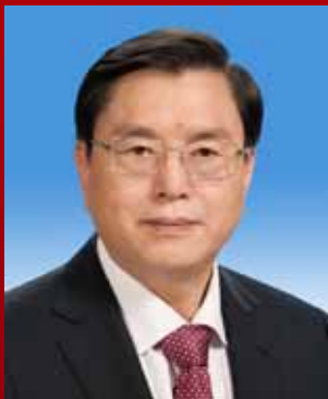
චං ද චියැං(Zhang Dejiang)

1955 වසරේ ජූලි මාසයේදී උපත ලැබුවේ චීනයේ ඇන්හුයි පලාතේ ඕන්ග්ශුවැන් ප්‍රදේශයේදීය. 1974 වසර වන විට ශ්‍රමබලකායට එක් වන හෙතෙම 1976 වසරේදී චීන කොමියුනිස්ට් පක්ෂයට එක්විය. 18වන ජාතික නියෝජිත සම්මේලනයේදී චීන කොමියුනිස්ට් පක්ෂ මධ්‍යම කමිටුවේ දේශපාලන ස්ථාවර කමිටු සාමාජිකයෙකු ලෙස තේරී පත්ව ඇති ඒ මහතා, වත්මන් චීන රාජ්‍ය සභාවේ උප අග්‍රාමාත්‍යවරයායි. එසේම පක්ෂයේ ප්‍රමුඛ සාමාජික කණ්ඩායමේ නියෝජ්‍ය ලේකම්වරයා ලෙස ද ඔහු කටයුතු කරයි. බීජින් විශ්ව විද්‍යාලයෙන් ආර්ථික විද්‍යාව පිලිබඳ උපාධිය ලබා ගත් ලී ක වාං මහතා ආර්ථික විද්‍යාව පිලිබඳ ආචාර්ය උපාධි ලාභියෙකි.