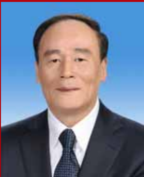
ලියූ යූන් ශන් (Liu Yunshan)

වත්මන් චීන රාජ්‍ය සභාවේ උප අග්‍රාමාත්‍යවරයෙකු වන වං චී ශන් මහතා 18 වන චීන කොමියුනිස්ට් පක්ෂ ජාතික නියෝජිත සම්මේලනයේදී පක්ෂයේ නව මධ්‍යම කමිටුවේ දේශපාලන ස්ථාවර සාමාජිකයෙකු ලෙස තේරී පත් විය. කොමියුනිස්ට් පක්ෂ මධ්‍යම විනය පරීක්ෂණ කොමිෂමේ වත්මන් ලේකම්වරයා වන්නේ ද ඒ මහතායි. චීනයේ ශාන්ෂී පලාතේ ටියැන්චං නගරයේදී 1948 වසරේ ජූලි මාසයේදී උපතල ද වං චී ශන් මහතා ශ්‍රම බලකායට එක්ව ඇත්තේ 1969 වසරේදීය. 1983 වසරේ ජනවාරි මාසයේදී චීන කොමියුනිස්ට් පක්ෂ සාමාජිකත්වය ලබා ගත් හෙතෙම චීනයේ වයඹ දිග විශ්ව විද්‍යාලයෙන් ඉතිහාසය පිලිබඳ උපාධිය ලැබීය. ඔහු ජ්‍යෙෂ්ඨ ආර්ථික විශේෂඥයෙකි.