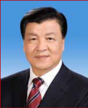
යූ චන් ශං (Yu Zhengsheng)

චීන කොමියුනිස්ට් පක්ෂ 18 වන ජාතික නියෝජිත සම්මේලනයේදී මධ්‍යම කමිටුවේ දේශපාලන ස්ථාවර කමිටු සාමාජිකයෙකු ලෙස තෝරා ගනු ලැබෙයි. ඔහු පක්ෂ ලේකම් කාර්යාලයේ සාමාජිකයෙකු මෙන්ම එහි ප්‍රචාරක දෙපාර්තමේන්තුවේ ප්‍රධානියා ද වෙයි. 1947 වසරේ ජූලි මාසයේ චීනයේ ශාන්ෂී පලාතේ ෂින්චෝවූ නගරයේදී ඔහු උප තලැබීය. 1966 වසරේදී ශ්‍රමබලකායට එක් ව ඇති ලියූ යූන් ශන් මහතා 1971 වසරේදී චීන කොමියුනිස්ට් පක්ෂ සාමාජිකත්වය ලබා ඇත. පක්ෂ මධ්‍යම පාසලෙන් ඔහු විශ්ව විද්‍යාල අධ්‍යාපනය ලබා තිබේ.