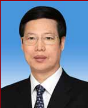
වං චී ශන් (Wang Qishan)

වං ගෝ ලී මහතා චීන කොමියුනිස්ට් පක්ෂ සාමාජිකත්වය ලබා ඇත්තේ 1973 වසරේදීය. චීනයේ හුජියැන් පලාතේ චින්ජියන් නගරයේදී 1946 වසරේ නොවැම්බර් මාසයේ උපතල ද ඔහු 1970 වසරේදී චීන ශ්‍රමබලකායට එක්ව ඇත. ෂියාමන් විශ්ව විද්‍යාලයෙන් ආර්ථික විද්‍යාව පිලිබඳ උපාධිය හෙතෙම ලබා ඇත්තේ සැලසුම් සහ සංඛ්‍යාලේඛණ විෂය පාදක කර ගනිමිනි. චීන කොමියුනිස්ට් පක්ෂ 18 වන ජාතික නියෝජිත සම්මේලනයේදී නව මධ්‍යම කමිටුවේ දේශපාලන ස්ථාවර කමිටු සාමාජිකයෙකු ලෙස තේරී පත් වූ වං ගෝ ලී මහතා කොමියුනිස්ට් පක්ෂ ටියැන්ජින් නාගරික කමිටුවේ ලේකම්වරයා ද වේ.