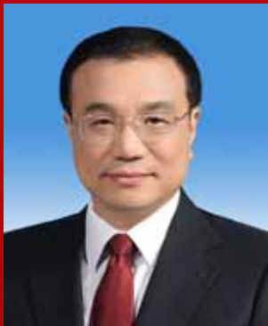
ලී ක වාං (Li Keqiang)

මෙවර චීන කොමියුනිස්ට් පක්ෂ 18වන ජාතික නියෝජිත සම්මේලනයේදී චීන කොමියුනිස්ට් පක්ෂ අහිතව මහලේකම්වරයා ලෙස ෂී ජින් පිං මහතා තෝරා පත් කර ගැනිණ. කොමියුනිස්ට් පක්ෂ මධ්‍යමය කොමිසමේ සභාපති ධුරය ද ඔහුට හිමි විය. දැනට චීන මහජන සමූහාණ්ඩුවේ උප රාජ්‍ය සභාපතිවරයා වන ෂී ජින් පිං මහතා චීන රජයේ මාධ්‍යම යුධ කොමිසමේ උපසභාපතිවරයා ද වේ. කොමියුනිස්ට් පක්ෂ මධ්‍යම පාසලේ සභාපති ධුරය උසුලන්නේ ද ඔහු විසිනි. චීනයේ ශාන් ඡී පලාතේ හුපින්හිදී 1953 වසරේ ජූනි මාසයේදී ෂී ජින් පිං මහතා උපත ලැබීය. 1969 වසරේදී ශ්‍රමබලකායට එක් වූ හෙතෙම චීන කොමියුනිස්ට් පක්ෂයට එක්වූයේ 1974 වසරේදීය. විත්භූවා විශ්ව විද්‍යාලයේ මානවභා සමාජවිද්‍යා අංශයෙන් උපාධිය ලබා ගත් ඔහු, එහිදී මාක්ස්වාදය, සංකල්ප වාදය සහ දේශපාලන අධ්‍යාපනය හදා රඳු ලැබීය. ඒ පිලිබඳ ප්‍රශ්නවත් උපාධිය ද ලබා ඇති ෂී ජින් පිං මහතා නීතිය පිලිබඳ ආචාර්ය උපාධි දාරියෙකි.