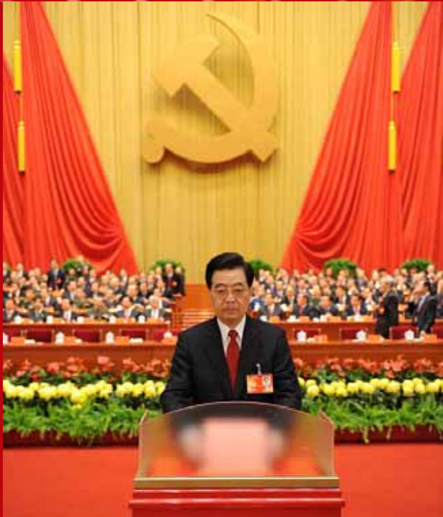
චීනයේ බෙයිජිං නුවර මහජන මහ ආලාවේ පැවැති කොමියුනිස්ට් පක්ෂ 18වන ජාතික නියෝජිත සම්මේලනයේදී චීන රාජ්‍ය සභාපති හු ජින් තාච් මහතා සිය ජන්දය භාවිත කල අයුරු