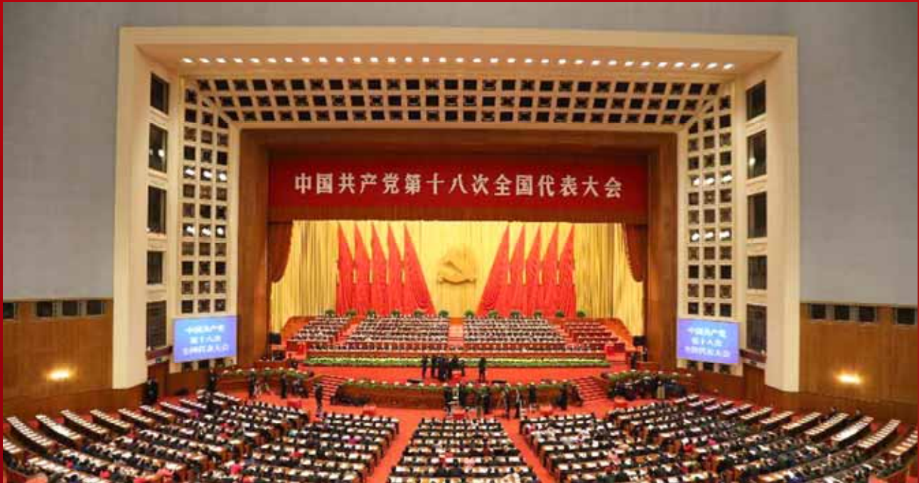
කොමියුනිස්ට් පක්ෂ 18 වන ජාතික නියෝජිත සම්මේලනයේ අවසන් සැසිය බෙයිජිං නුවර මහජන මහආලාවේ පැවැති ආකාරය (2012 නොවැම්බර් 14)